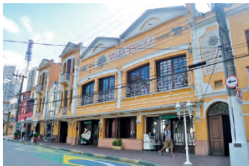
Villa Tavola, no bairro do Bixiga, na cidade de São Paulo.

7| À medida que um povo constitui o seu lugar, com suas construções típicas, suas cores e seus sentimentos, a paisagem vai sendo formada e transformada. Como forma de manter a tradição viva e amenizar a saudade, diversos povos recriam, em outros países, lugares que remetem à sua cultura.