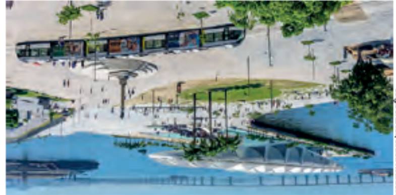
Rio de Janeiro, Brasil.

2 | Observe a imagem e responda ao que se pede.