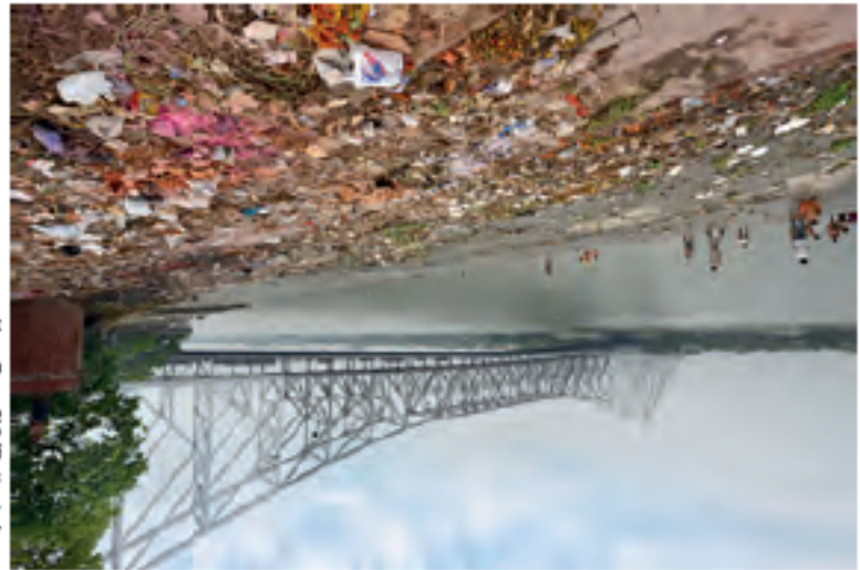
Ponte em Calcutá, Índia.