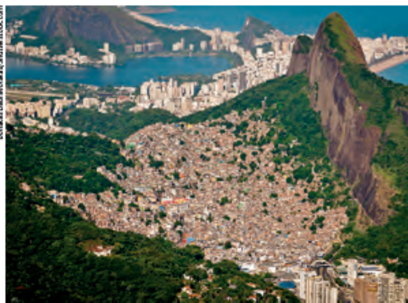
Conjunto de casas de comunidade carente, na cidade do Rio de Janeiro, próximo de prédios da classe média alta.