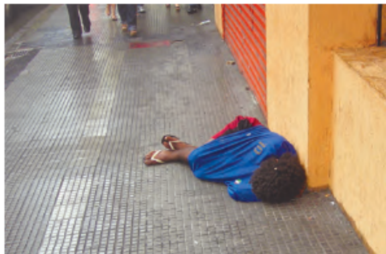
Pessoa em situação de rua dormindo enrolada em sua própria roupa, no Rio de Janeiro.

Espaço geográfico é a representação de como uma sociedade é organizada.